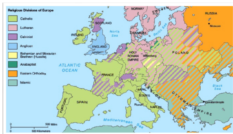
Prikaz 6: Ostaci pravoslavnog prostora na Balkanu pod islamsko-otomanskom upravom. Iza limesa Antemurale christianitatis – ulaz u novi vek, XVI stoleće

Figure 6: The remains of the Orthodox area of the Balkans under the Ottoman-Islamic rule. Behind the limes Antemurale christianitatis – 16 th century