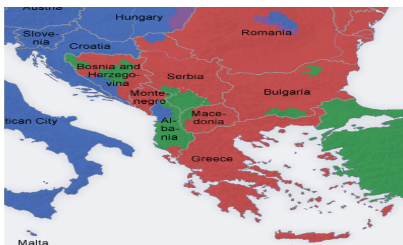
Prikaz 1: Razmeštaj civilizacija na Balkanskom poluostrvu

sa izlazom na Bosfor, i duž turskog dela Crnog mora). Potom, tu su i dva „islamska džepa” u Bugarskoj (jedan na jugu u Trakiji, i jedan, manji, severoistočni, u bugarskom Podunavlju). Albanski islamski prostor zaposeda ne samo čitavu centralnu već i najveći deo južne (ali i pojas severne) Albanije u Prokletijama, potom gotovo čitavu zapadnu Makedoniju i gotovo čitavu južnu srpsku pokrajinu Kosovo i Metohiju, te pogranični pojas Grčke u Epiru. Konačno, tu su enklave muslimansko-slovenskog življa, koji se danas u najvećem broju izjašnjava kao Bošnjaci (u Raškoj ili Sandžaku u Srbiji, na severu Crne Gore, i najviše u centralnoj Bosni sve do srednjih tokova Neretve do Stoca, kao i u Cazinskoj Krajini).