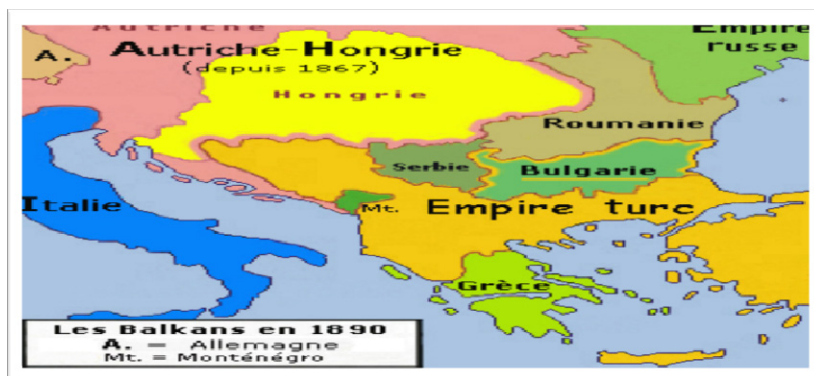
Prikaz 7. Novoformirane balkanske države: arhipelag u otomanskom moru „evropske Turske”