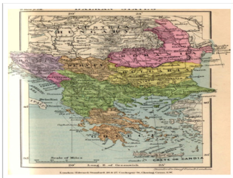
Prikaz 8: Istočni i Zapadni Balkan nevidljivom linijom granica Srbije sa Rumunijom i Bugarskom: od Đerdapske klisure preko Stare planine

omogućava uticaj u istočnom Balkanu (iako je ovaj deo Balkana već anektiran u čvrste strukture EU i NATO-a – Rumunija i Bugarska), ali ne i na Zapadnom Balkanu (Srbija, Crna Gora, BiH), koji je uvek bio naklonjeniji ruskom faktoru. Odsecanjem Albanije koridorom Zapadnog Balkana, i Grčke (sukobljavajući je sa Rusijom – a preko bugarskih aspiracija da izađe na toplo Egejsko more) zapadne sile su uspele da veoma dugo Rusiju drže u jednoj vrsti šah-pozicije, onemogućavajući joj prodor na Jadran, Egej i Bosfor. Rusiji nametnuta linija između Zapadnog i Istočnog Balkana aktualizovana je u nekoliko navrata: od carice Jekatarine i kasnijeg San-Stefanskog sporazuma preko izvlačenja Brozove Jugoslavije iz ruskog uticaja moći, sve do današnjih dana kada se Rusija preko energetskih sporazuma ponovo vraća na Balkan i to najpre u Bugarsku, a potom i u Srbiju, BiH (kroz manji entitet – Republiku Srpsku) i Crnu Goru (kupovina zemljišta na primorju i ulaganja u kapitalne privredne kapacitete Crne Gore). Predmet ruskih aspiracija je i Rumunija, koja je zajedno sa Bugarskom deo NATO-a i EU, ali od koje Rusija neće lako odustati, jer je kopneno povezuje sa južnoslovenskim narodima.