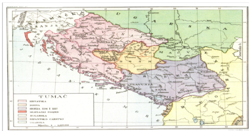
Prikaz 3: Srbija – od Neretve do Drima, razvijeni srednji vek